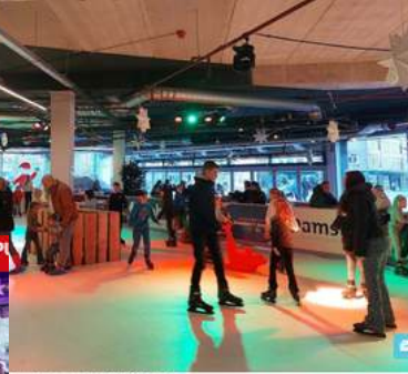
tot: 24 december 2024 22:00 : schaatsbaan en kerstmarkt ngelot

Vorig jaar werd de schaatsbaan voor het eerst verplaatst naar een nieuwe locatie, in het voormalige V&D pand. Vanwege de hoge kosten en met het klimaat in het achterhoofd werd gezocht naar een passend alternatief voor het plein voor het stadhuis. Bovendien is er dit jaar weinig plek op die locatie vanwege de bouw van de horecawand.