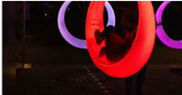
Schemmen in Led Slings

De tweede editie van het festival LICHT Hengelo trok zaterdag- en zondagavond duizenden bezoekers naar de binnenstad en Hart van Zuid. Dat stadsdeel vormde een mooie toevoeging aan de route, nadat de eerste editie in 2022 beperkt bleef tot het centrum.