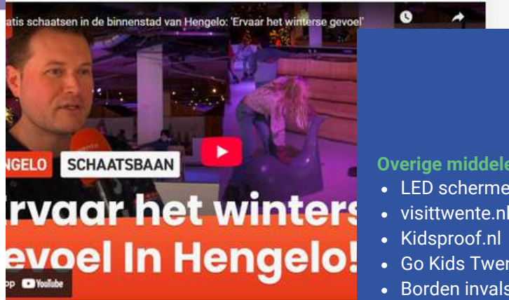
Wie van schaatsen houdt, kan de komende weken volop zijn hart ophalen in