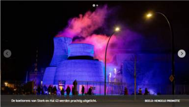
De koetswens van Stork en Hal 43 werden prachtig uitgelicht.